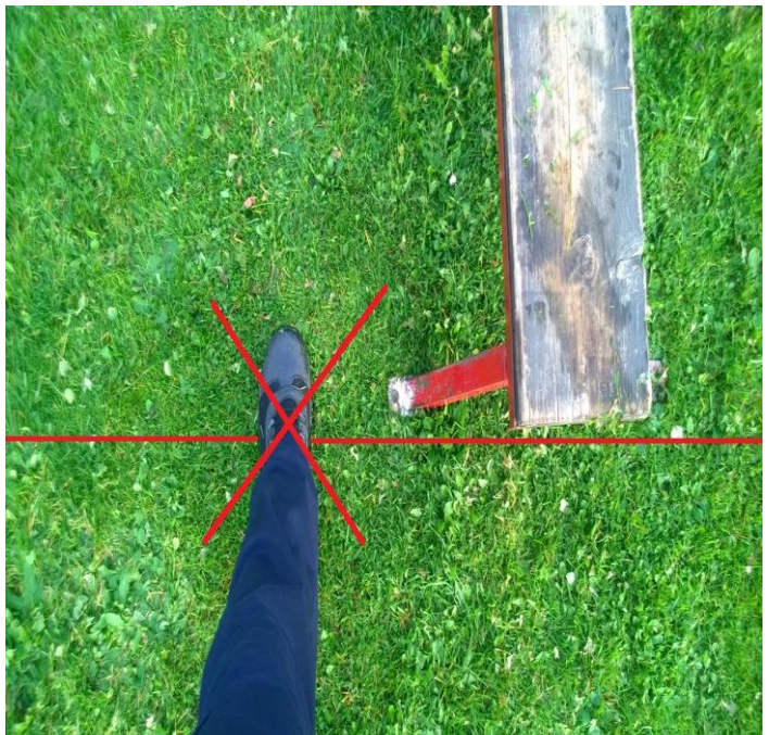
Kuva 4 Virheellinen puomin lähestyminen