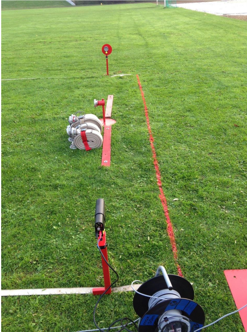
Kuva 1, malliesimerkki aloituksesta