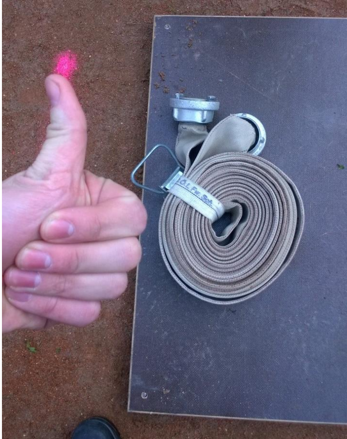
Kuva 82 Letkunkannattimen sallittu reunan ylitys