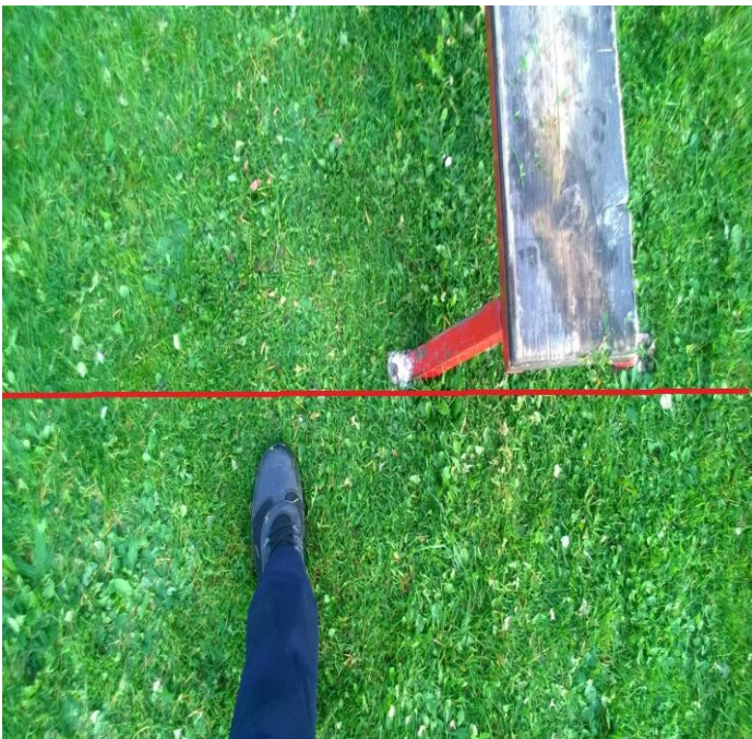
Kuva 3 Puomin sallittu lähestyminen